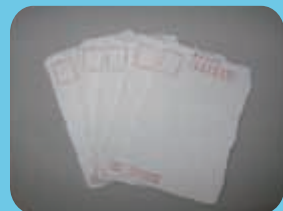
<絵手紙用のハガキ>