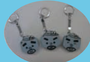
<玄さん キーホルダー>